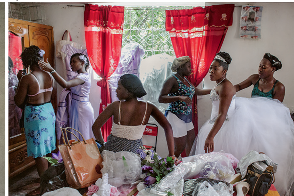
« Les demoiselles d'honneur s'activent autour de la mariée. Elles ont investi une pièce chez des voisins qui avaient de la place. Les familles les plus aisées louent une chambre à l'hôtel. »