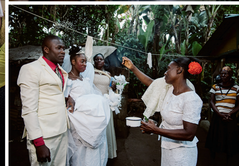
«La maman du marié jette du riz et de l'eau bénite sur les époux. Un repas leur a été préparé. Même les familles les plus modestes offrent une table, deux chaises et un peu nourriture, quitte à ce que tous les autres restent debout.»