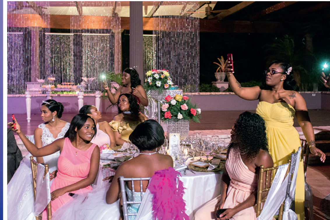
« Un célèbre artiste se marie à Pétion-Ville, la commune chic de Port-au-Prince. »