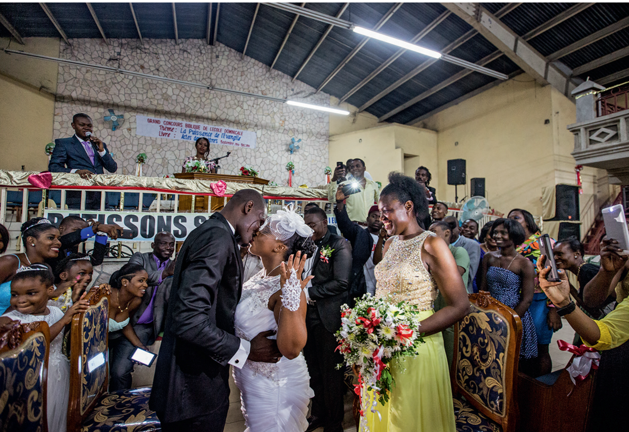
«Les cérémonies prennent souvent du retard, si bien que le générateur finit par ne plus fonctionner. La fête a alors lieu dans le noir.»