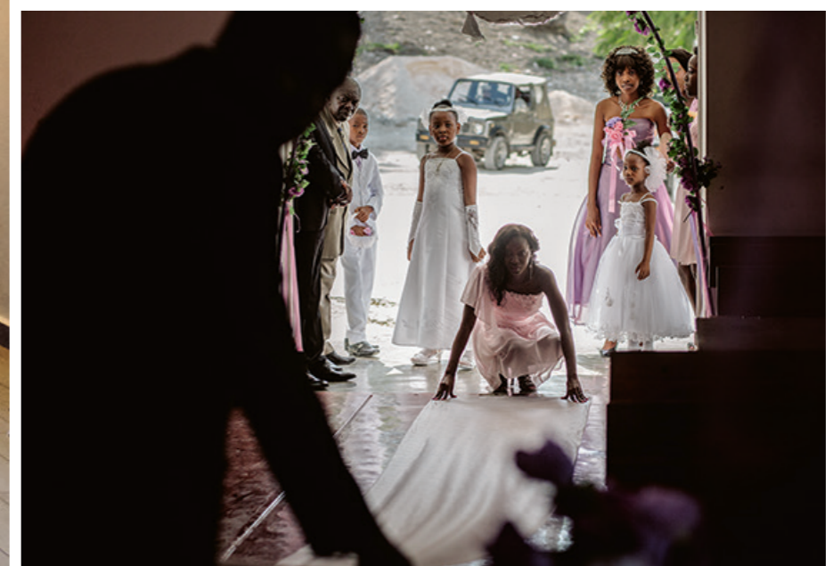
« Un tapis est toujours déroulé à l'entrée de l'église. Ici, il a été oublié, une demoiselle d'honneur se dépêche de l'installer avant l'arrivée des invités. »