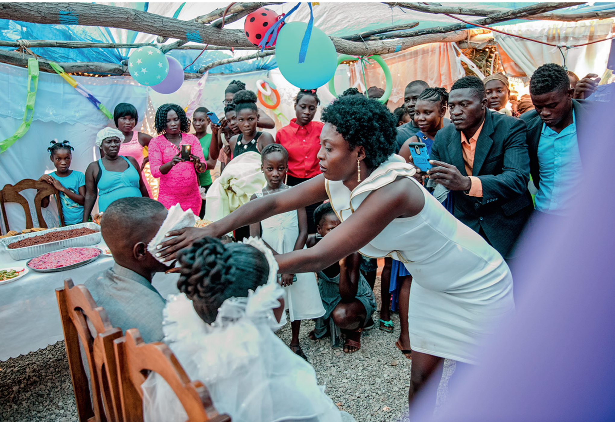
« Un repas est servi pour la famille proche. Plus loin, un buffet avec des marmites de riz, du pâté et des bananes plantains est prévu pour les autres invités. »